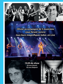
Tribute Delpéch - Dassin