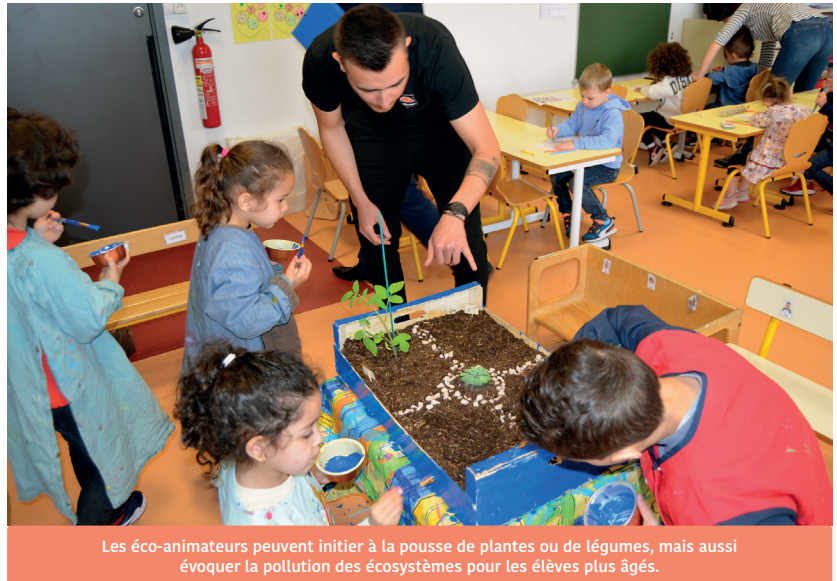
Les éco-animateurs peuvent initier à la pousse de plantes ou de légumes, mais aussi évoquer la pollution des écosystèmes pour les élèves plus âgés.

“ 150 CLASSES SONT CONCERNÉES PAR CE PROGRAMME D'ÉCO-ANIMATIONS