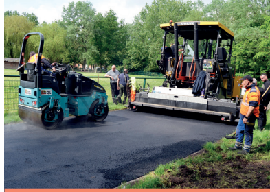
Finis les nids de poule pour nos allées du parc côté ferme pédagogique.

Pour s'inscrire, il vous suffit d'envoyer un mail en précisant vos nom, prénom, adresse, téléphone, adresse mail, le BAC obtenu et l'établissement à sabine.rysman@ville-watrelos.fr et corinne.bourgy@ville-watrelos.fr .