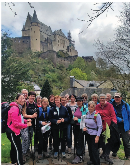
La sympathique équipe de l'association Rando, Evasion et Découverte (RED)

17 membres de RED sont partis quatre jours (28 avril-1er mai) au Luxembourg, dans l'ancien comté de Vianden. Au programme : marche (deux groupes de niveaux), balades, visites touristiques, découverte de la nature. Un merveilleux séjour en pension complète !