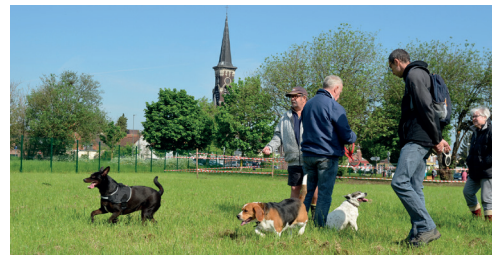
Les chiens peuvent aussi s'amuser en toute sécurité au Touquet, à présent

Après celui situé à l'arrière du parc du Lion (entrée par le boulevard Cambray), un nouveau parc s'est ouvert au Touquet Famille Saint-Gérard, le long du boulevard Famille Saint-Ghislain, le 13 mai dernier. Les chiens doivent être sous la surveillance de leurs maîtres (âgés de 14 ans minimum, deux chiens maximum par propriétaire) et le ramassage des crottes est obligatoire (se munir de sacs). N'oubliez pas de bien fermer la porte derrière vous !